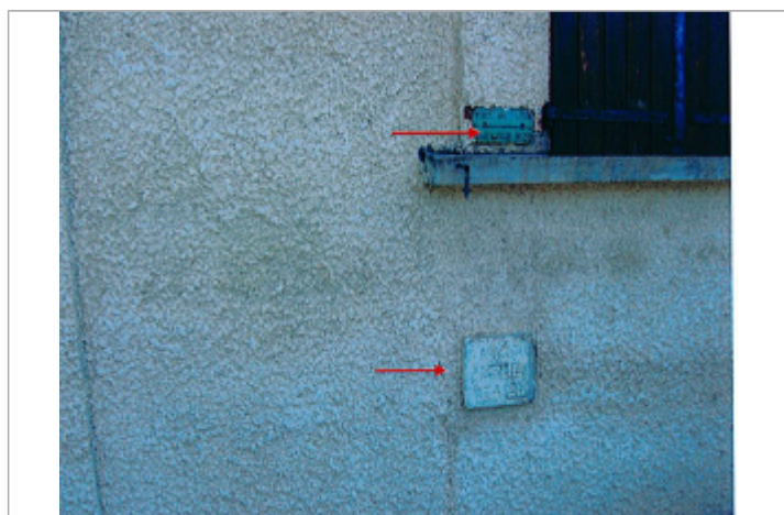
Sur cette photo le repère de 1930 est présent au niveau de l'allège de la fenêtre