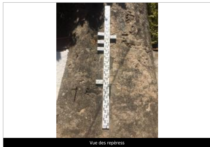
Vue des repèress