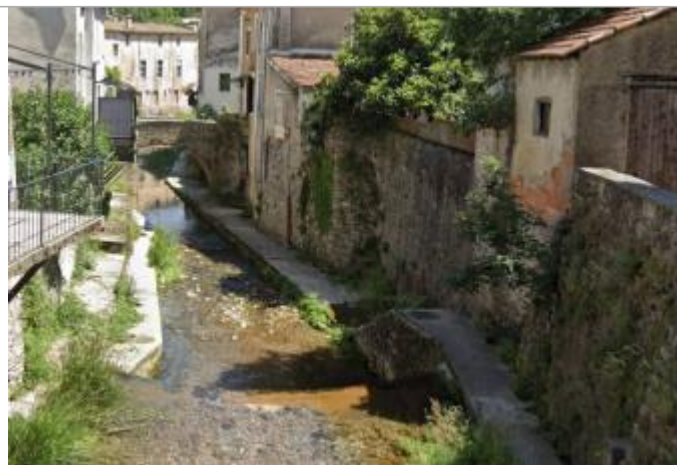
Vue du site ( Pont de Chazal)