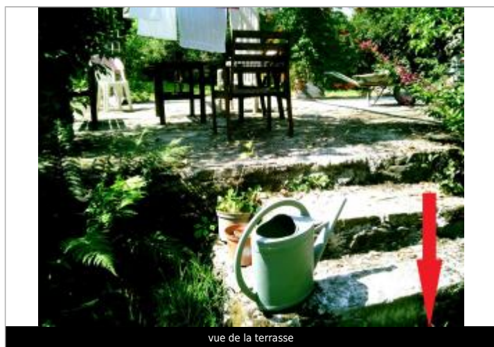
vue de la terrasse