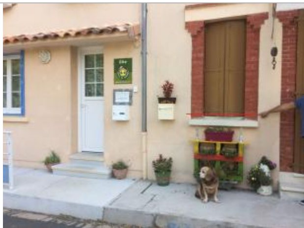
Vue de la façade. L'eau est montée jusqu'au-dessus de l'allège de la fenêtre (trait rouge)

Différence entre le niveau d'eau et la référence (en m) : 1.230 m