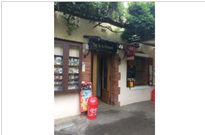
Vue de la façade