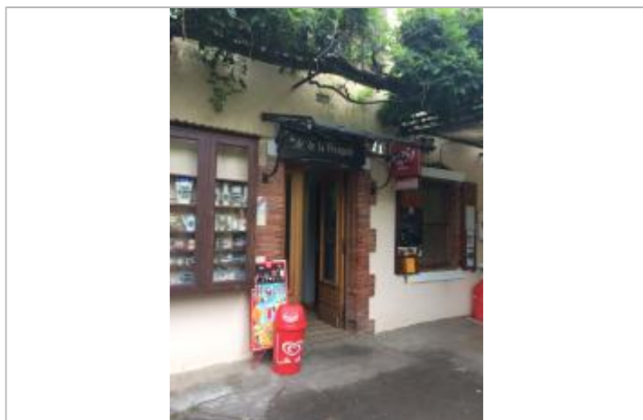
Vue de la façade du Café de la presqu'île

Altitude calculée de l'eau (en m) : 197.655