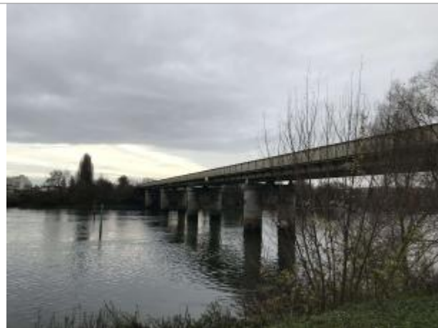
Pont de chemin de fer