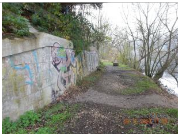
Plaque de la crue du 21 mars 1876

Altitude calculée de l'eau (en m) : 6.712 m