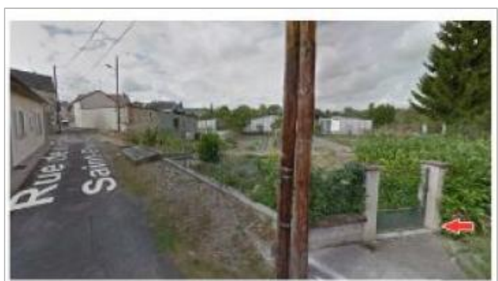
Repère sur le parapet du pont en rive droite

MARQUE Texte : Inondation du 22 septembre 1890 Maximum de l'inondation : Oui Visibilité : Oui