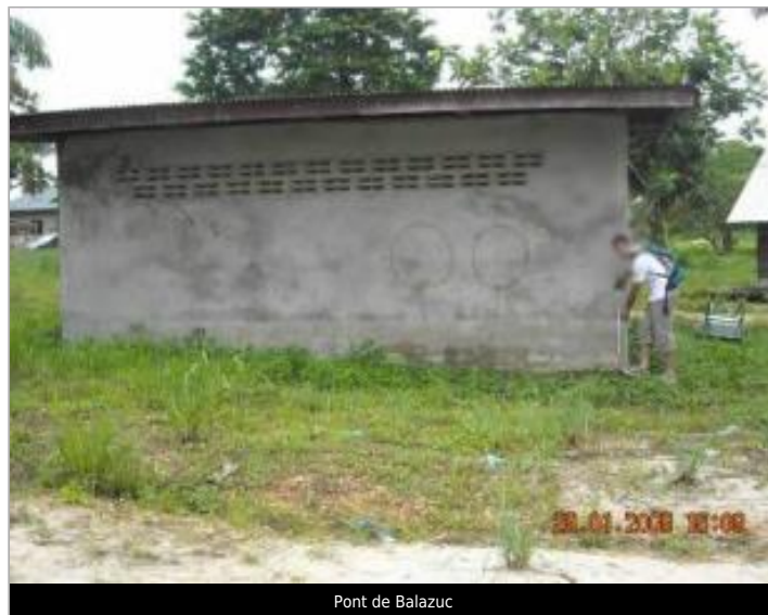
Pont de Balazuc