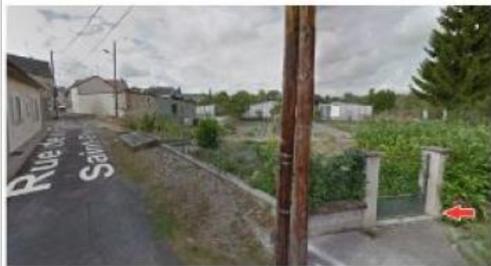
Repère sur le parapet du pont en rive droite