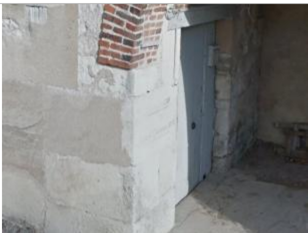
Vue des repères