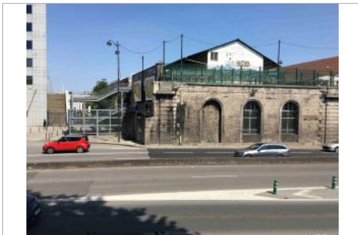
Vue depuis le quai