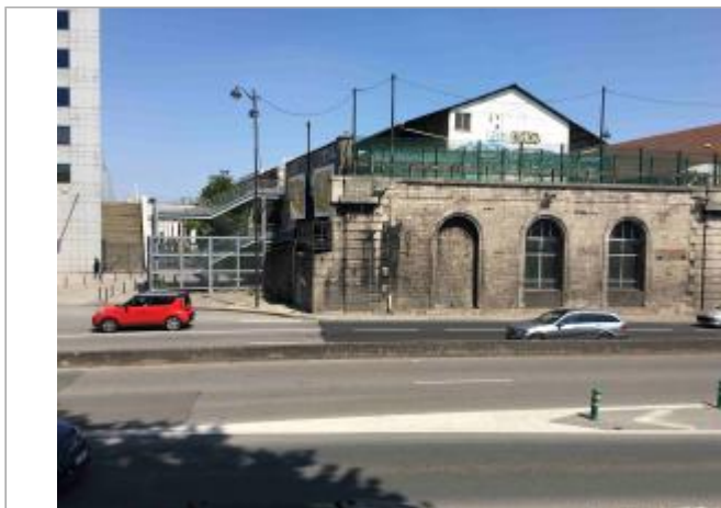
Vue depuis le quai

Coordonnées WGS84 : X: 2.38711500 / Y: 48.82982700