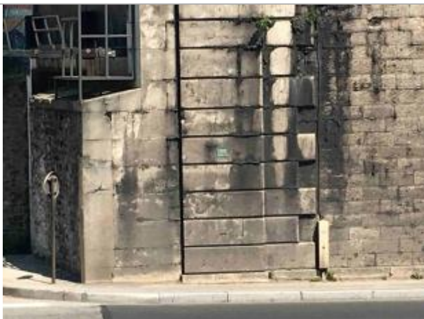
Zoom sur le repère

Altitude calculée de l'eau (en m) : 34.905 m