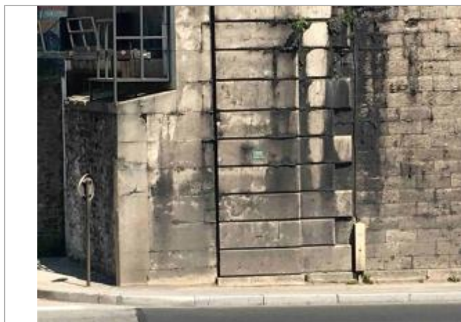
Zoom sur le repère