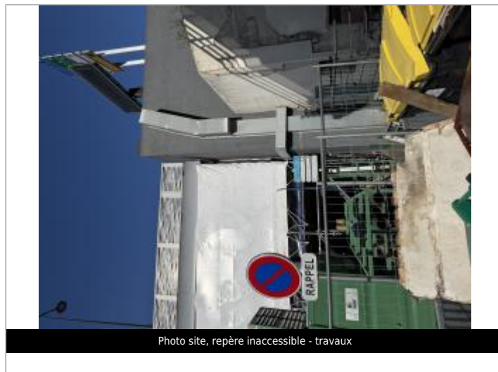
Photo site, repère inaccessible - travaux