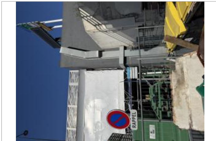
Photo site, repère inaccessible - travaux