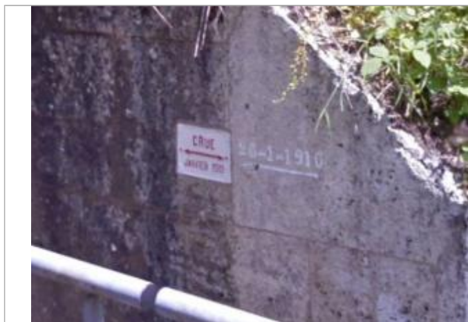
Photo des repères

Altitude calculée de l'eau (en m) : 56.529 m