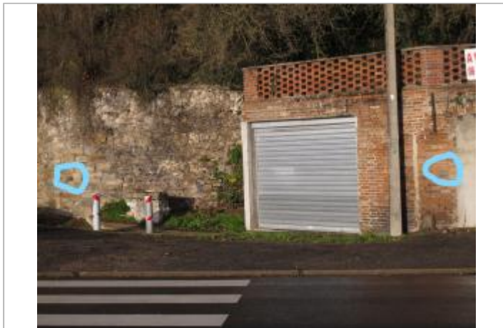
deux supports de plaque de repère de crue