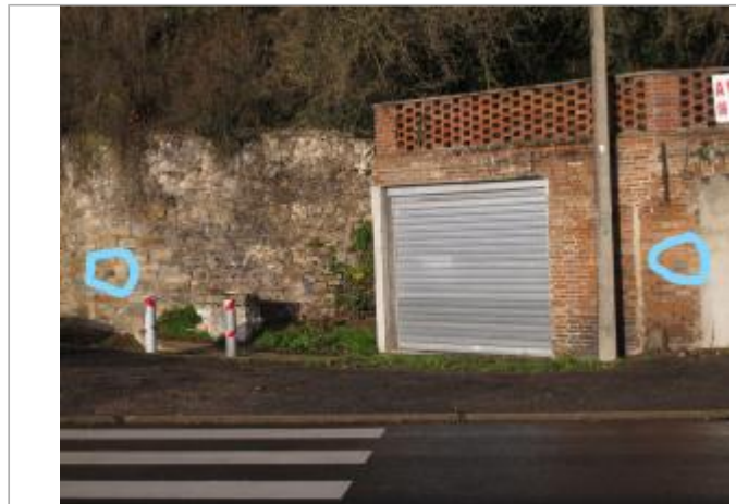
deux supports de plaque de repère de crue

Coordonnées WGS84 : X: 2.95529600 / Y: 48.38936000