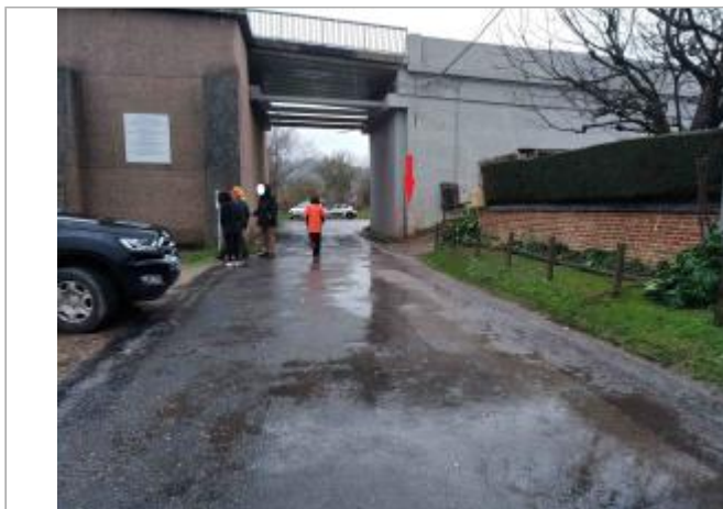
Pilier du pont des Andelys

Coordonnées WGS84 : X: 1.39771000 / Y: 49.23645800