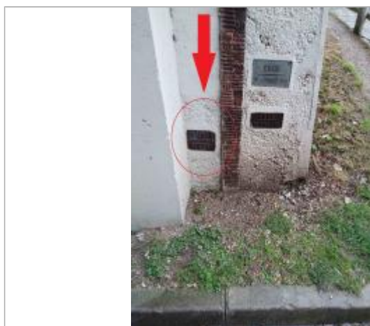
Vue du repère 1876