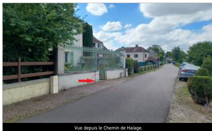
Vue depuis le Chemin de Halage.

GÉOLOCALISATION Coordonnées WGS84 : X: 1.24618000 / Y: 49.30492900 Coordonnées RGF93 (Lambert 93) X: 572433.64 / Y: 6913119.57 Coordonnées RGF93 (ETRS89) : X: 1.24618 / Y: 49.304929 Code Hydro : ----0010 Rive de référence : Gauche