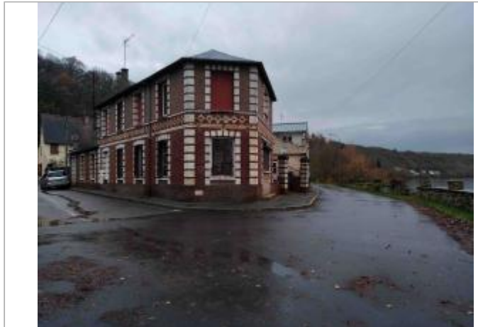
2 Rue Emile Laguette.

Coordonnées WGS84 : X: 1.33410770 / Y: 49.18945700