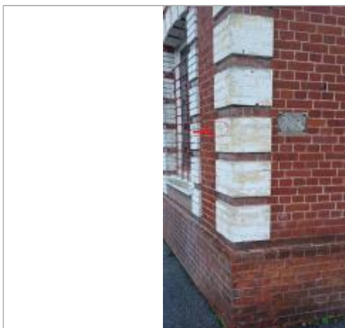
Trace gravée "1966" à 165 cm/sol.

NIVELLEMENT SPC SACN. LE SPC N'EST PAS GÉOMÈTRE EXPERT, LES CÔTES SONT DONNÉES À TITRE INDICATIF. - 20/12/2022