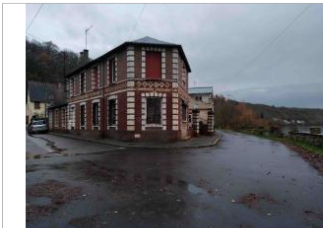
2 Rue Emile Laguette.

Coordonnées WGS84 : X: 1.33410770 / Y: 49.18945700