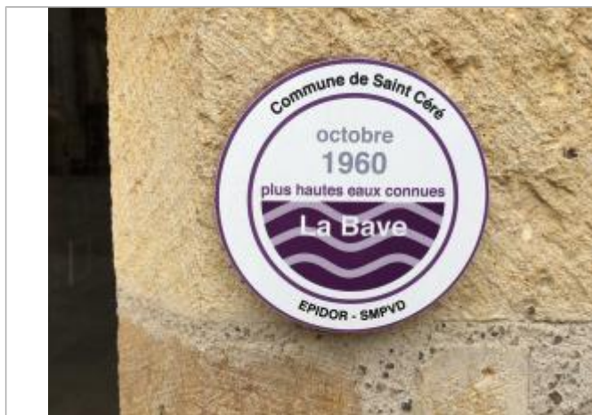
Vue rapprochée du repère - Auteur : Olivier Ptotte