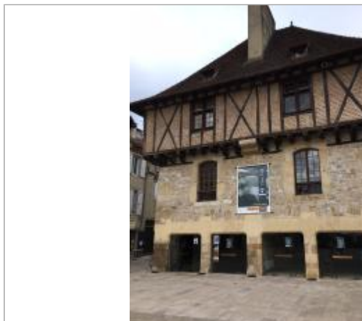
Vue depuis la place - Auteur : Olivier Ptotte