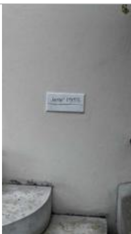
Repère de la crue de 1955 à côté de l'escalier d'entrée