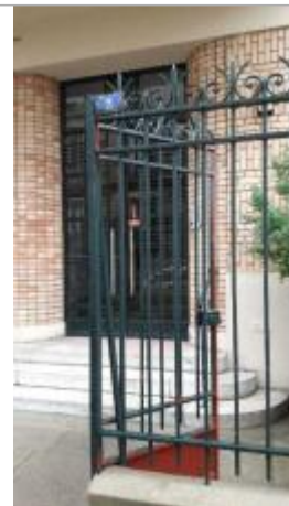
2 rue Alice Courbevoie