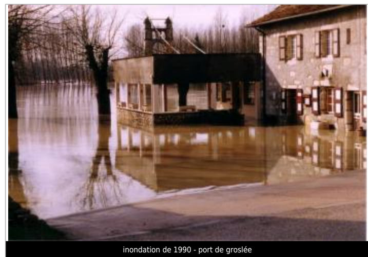
inondation de 1990 - port de groslee

GÉNÉRAL Code : D_GROS_1_1990 Date de mise à jour : 12/03/2020 Auteur : SHR