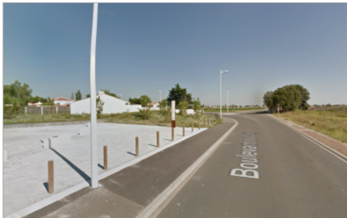
Memorial aux victimes de l'inondation du 28 fév 2010