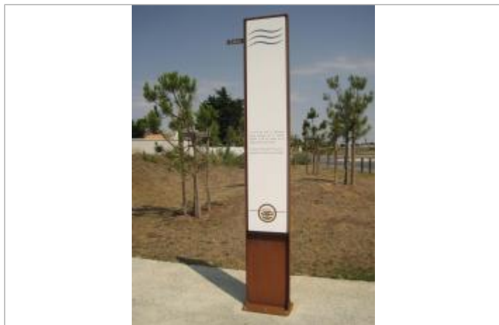
totem-repère de crue