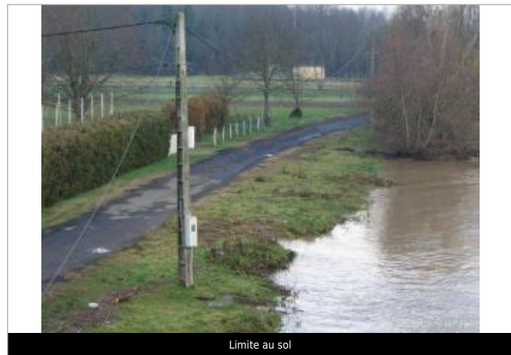
Limite au sol