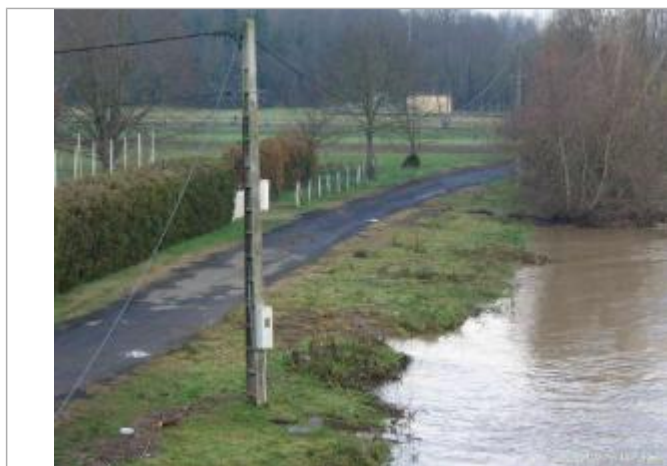
Limite au sol

Altitude calculée de l'eau (en m) : 295.46 m