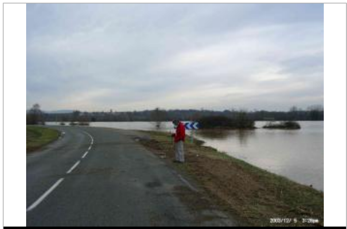
Limite au sol

GÉNÉRAL Code : WEB_R_201707111540 Date de mise à jour : 19/06/2018 Auteur : SPC Allier