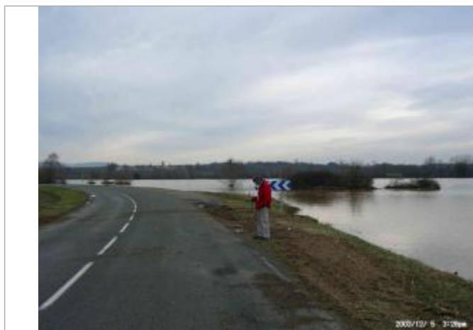
Limite au sol

Altitude calculée de l'eau (en m) : 285.85 m