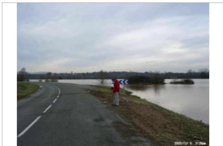
Limite au sol

Code : WEB_R_201707111540 Date de mise à jour : 19/06/2018 Auteur : SPC Allier