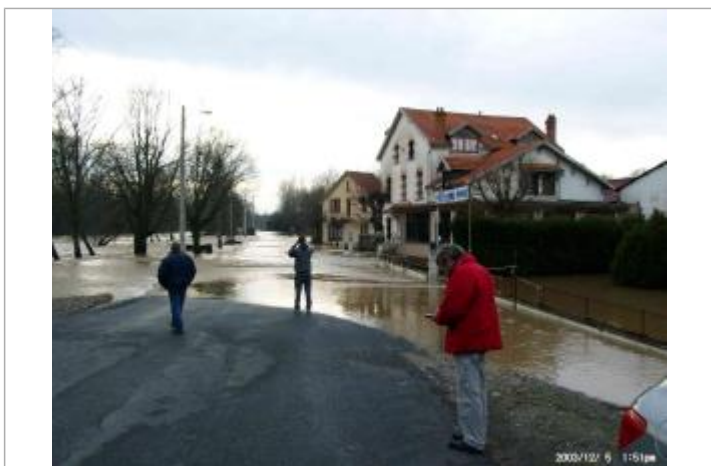
Limite au sol

GÉNÉRAL Code : WEB_R_201707111605 Date de mise à jour : 27/03/2024 Auteur : SPC Allier