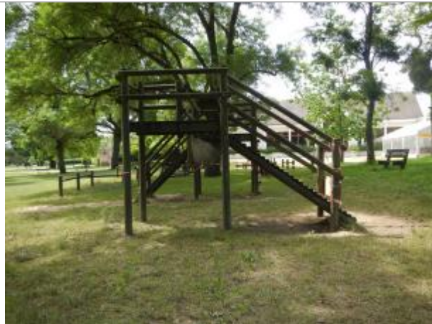
Site en juin 2017