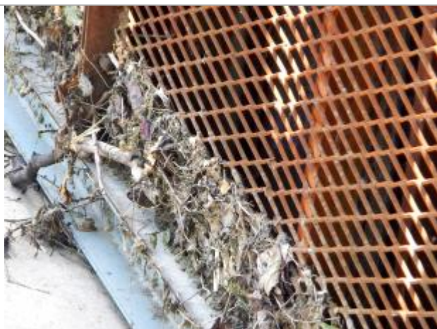
Détail du repère de la crue de juin 2016