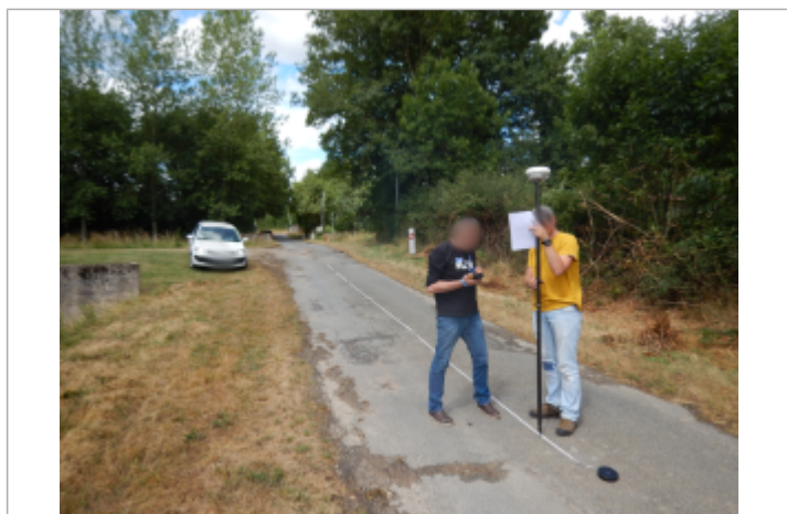
Emplacement du repère en 2017

Visibilité : Oui État du repère : Non renseigné Pérennité : Moyenne