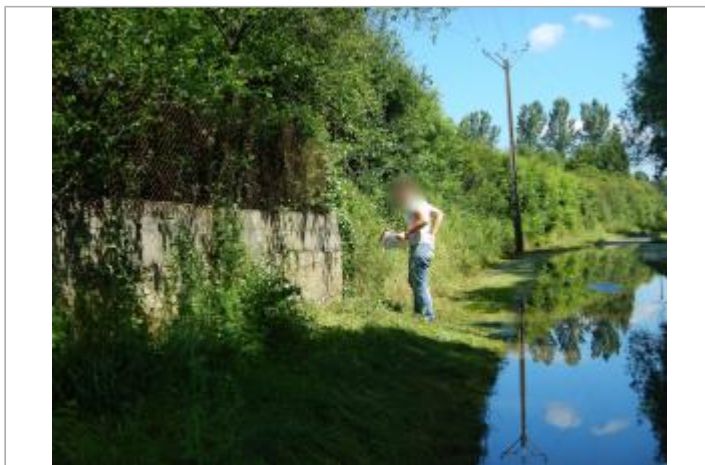
Site pendant la crue de juin 2016