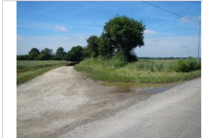
Chemin du Platois, le site se trouve près du carrefour avec le chemin gravillonné