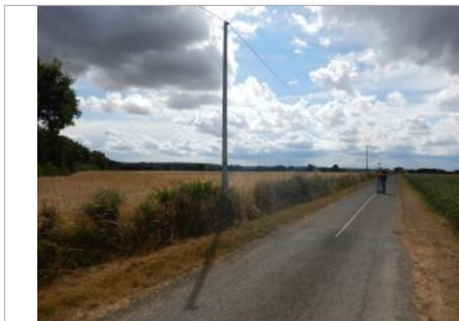
Repère à 15 m du poteau EDF