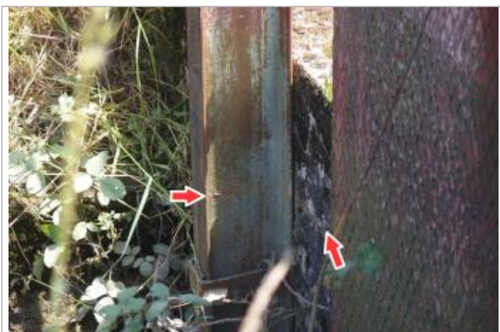
Repère de la crue de juin 2016