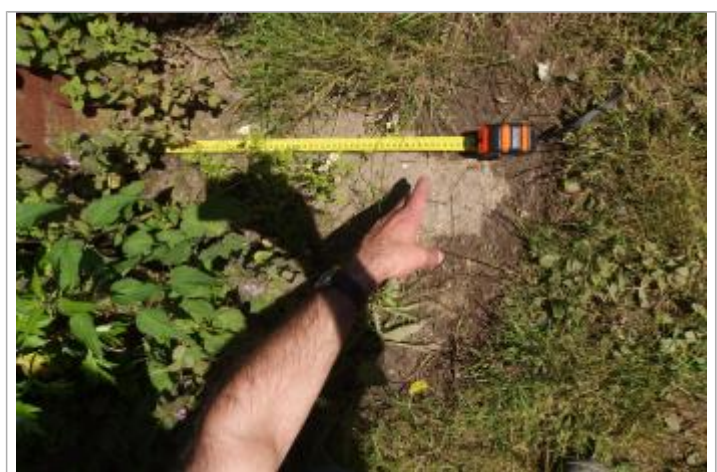
Détail du repère de la crue de 2016

MARQUE Visibilité : Oui État du repère : Disparu Pérennité : Aucune