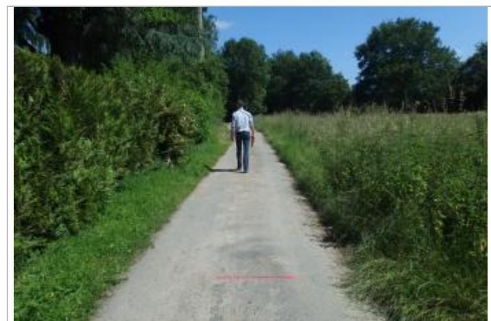
Repère : marque de peinture sur la chaussée