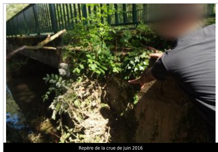
Repère de la crue de juin 2016

MARQUE Visibilité : Oui État du repère : Disparu Pérennité : Aucune