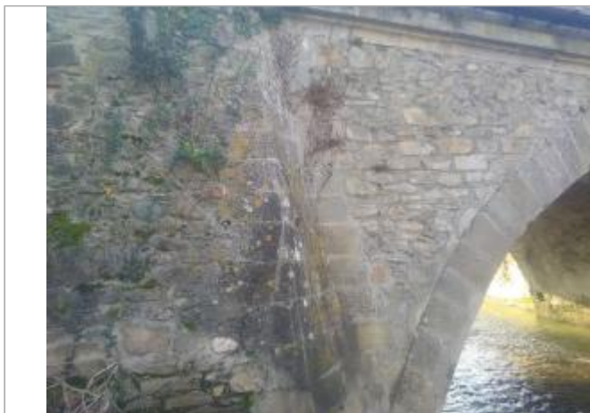
site pont RD620