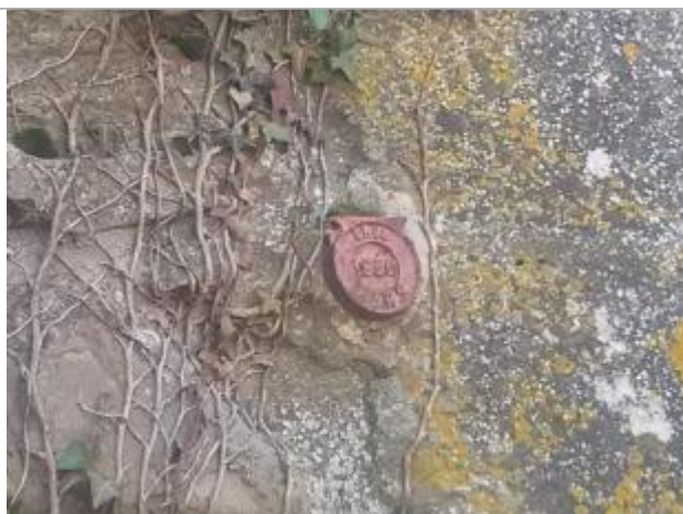
repère mars 1930

Altitude calculée de l'eau (en m) : 168.324