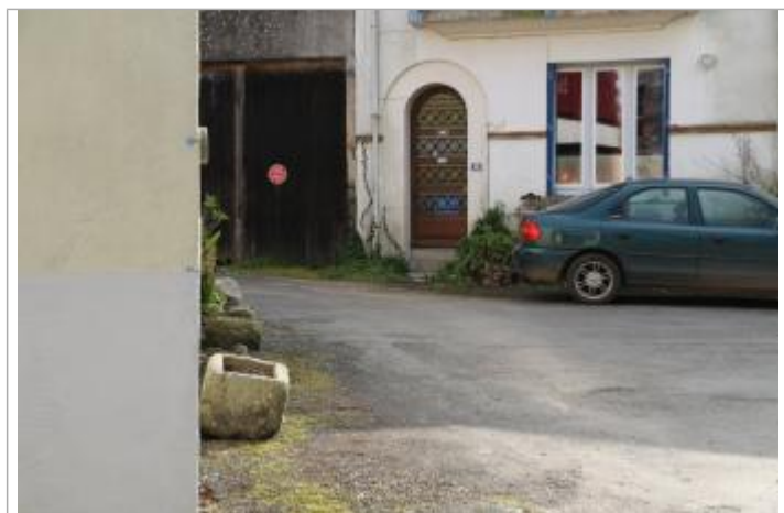
Vue du repère - Auteur : EPTB Sèvre Nantaise

Type de repérage : Source bibliographique Organisme : EPTB Sèvre nantaise