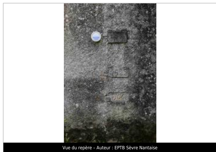
Vue du repère - Auteur : EPTB Sèvre Nantaise