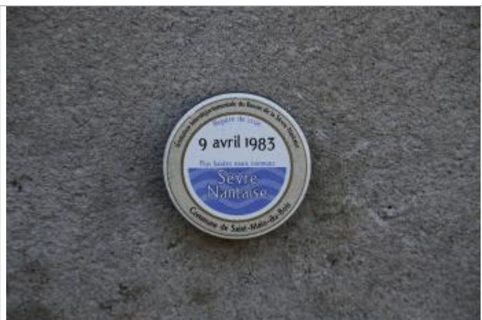
Vue du repère - Auteur : EPTB Sèvre Nantaise

Altitude calculée de l'eau (en m) : 124.84 m