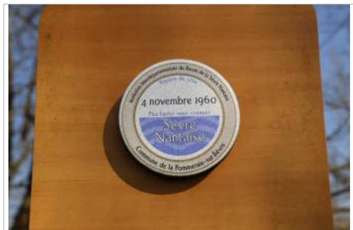
Vue du repère - Auteur : EPTB Sèvre Nantaise

Maximum de l'inondation : Oui Visibilité : Oui État du repère : Bon Pérennité : Longue Repère calculé : Non renseigné PHEC : Non renseigné