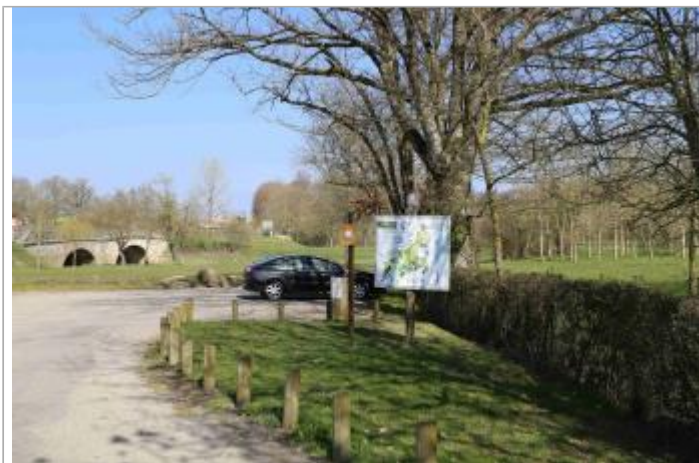
Vue du site - Auteur : EPTB Sèvre Nantaise