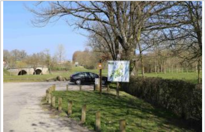
Vue du site - Auteur : EPTB Sèvre Nantaise

Coordonnées WGS84 : X: -0.77429300 / Y: 46.83881900