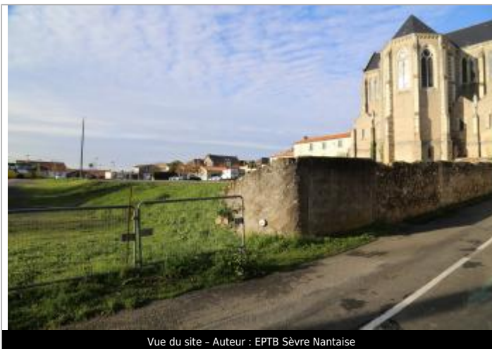
Vue du site - Auteur : EPTB Sèvre Nantaise