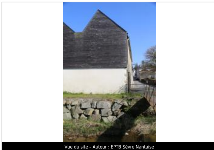
Vue du site - Auteur : EPTB Sèvre Nantaise

Coordonnées WGS84 : X: -0.75735200 / Y: 46.92509700