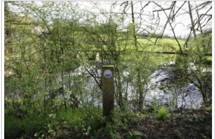
Vue du site - Auteur : EPTB Sèvre Nantaise

Coordonnées WGS84 : X: -1.00836100 / Y: 47.06741600