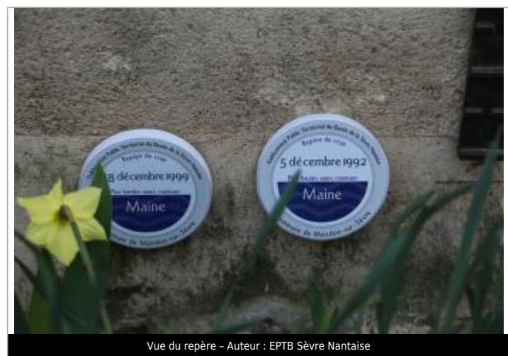
Vue du repère - Auteur : EPTB Sèvre Nantaise