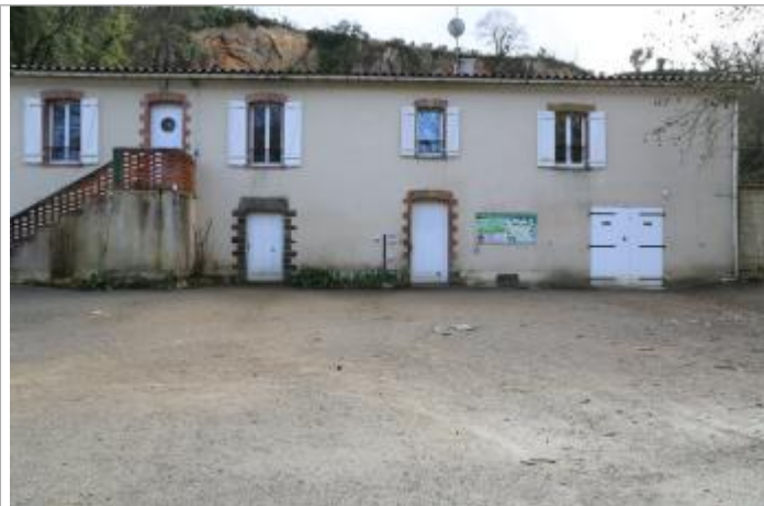
Vue du site - Auteur : EPTB Sèvre Nantaise

Coordonnées WGS84 : X: -1.41573020 / Y: 47.12435480