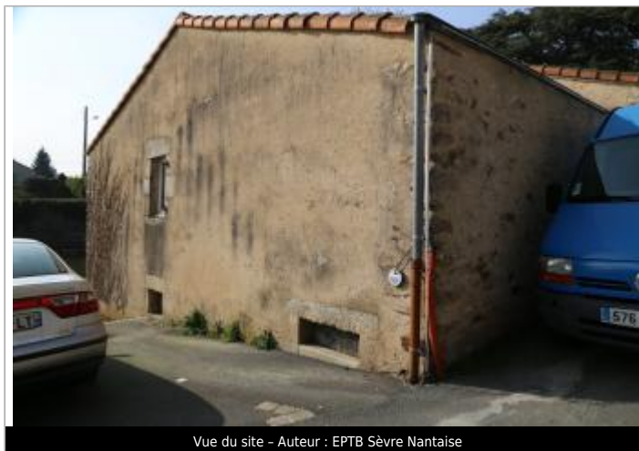
Vue du site - Auteur : EPTB Sèvre Nantaise