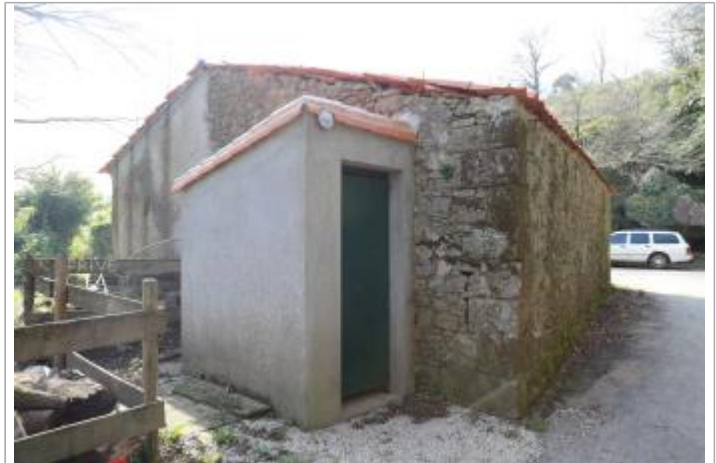
Vue du site - Auteur : EPTB Sèvre Nantaise

Coordonnées WGS84 : X: -1.13344000 / Y: 47.02251000