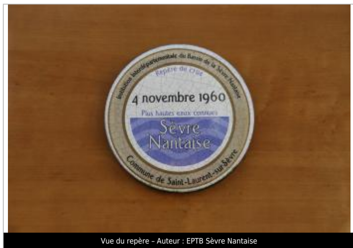
Vue du repère - Auteur : EPTB Sèvre Nantaise

Altitude calculée de l'eau (en m) : 114.43