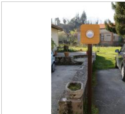
Vue du site - Auteur : EPTB Sèvre Nantaise

Coordonnées WGS84 : X: -0.88379100 / Y: 46.95321500