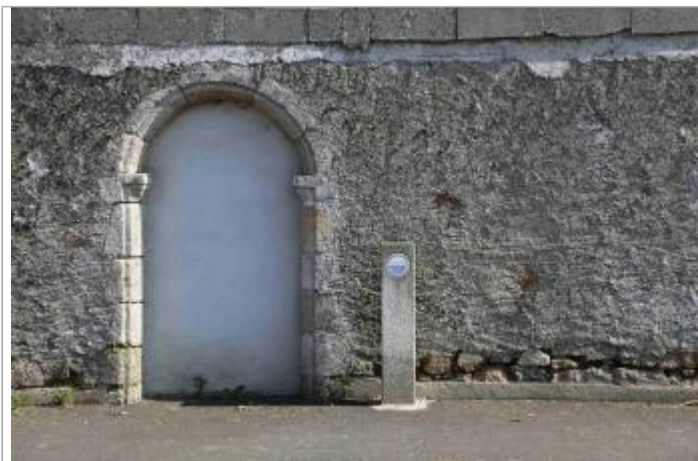
Vue du site - Auteur : EPTB Sèvre Nantaise