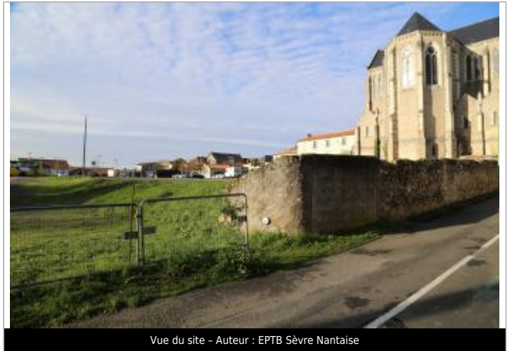
Vue du site - Auteur : EPTB Sèvre Nantaise