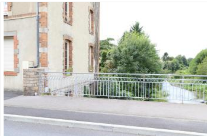
Vue du site - Auteur : EPTB Sèvre Nantaise